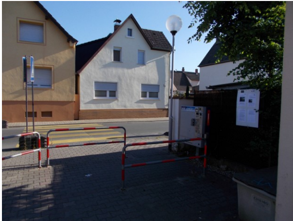
Standort: Schloßschule in Gräfenhausen in der Schloßgasse